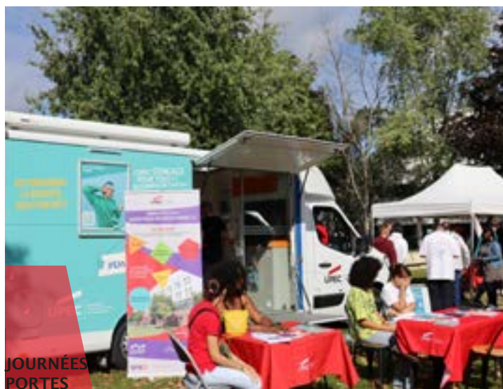
JOURNÉES PORTES OUVERTES