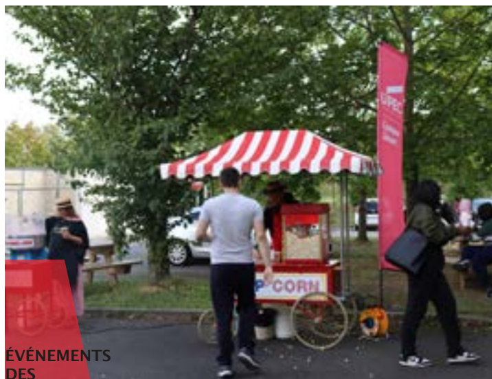
ÉVÉNEMENTS DES CAMPUS