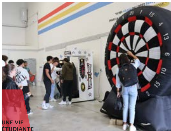
UNE VIE ÉTUDIANTE DYNAMIQUE