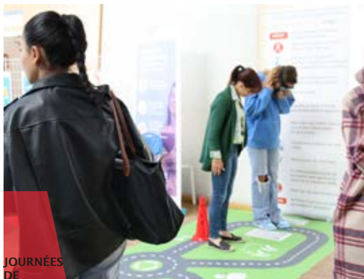
JOURNÉES DE SENSIBILISATION