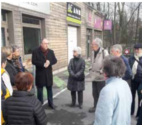
Début de la visite de quartier : centre commercial Talma

Pour autant, chaque Brunoyen peut être acteur de cette lutte quotidienne qui en ramassant un déchet isolé, qui en notifiant les services techniques, via le formulaire disponible sur le site internet de la ville (Formulaires en ligne / Signalement d'incident sur voie publique) de la présence de déchets, de tags, d'une problématique de végétation débordante ou de dysfonctionnement d'un équipement public (éclairage par exemple).